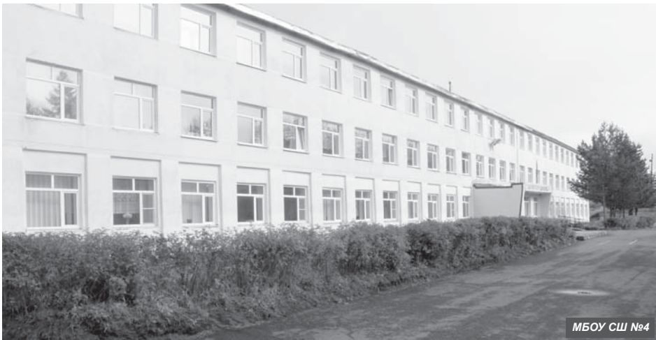
МБОУ СШ №4