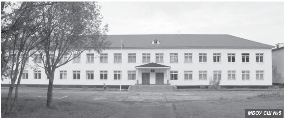
МБОУ СШ №5