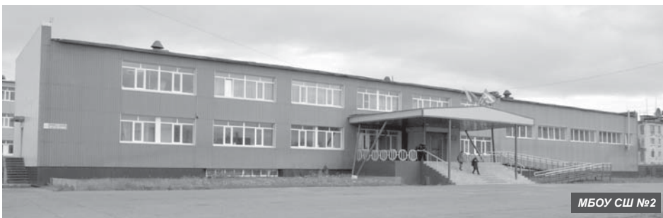
МБОУ СШ №2

5 октября в России отмечают один из самых главных осенних праздников – День учителя.