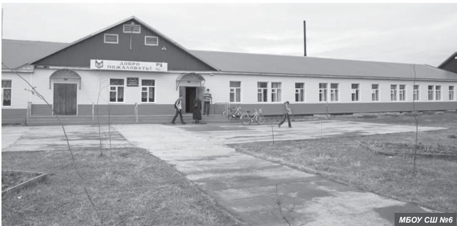
МБОУ СШ №6

Слова благодарности и признательности в этот день мы говорим людям, чья профессия – учить, воспитывать, давать уроки нравственности, добра, патриотизма подрастающим поколениям. Это нелегко и крайне ответственно. Именно поэтому профессия учителя так уважаема и значима.