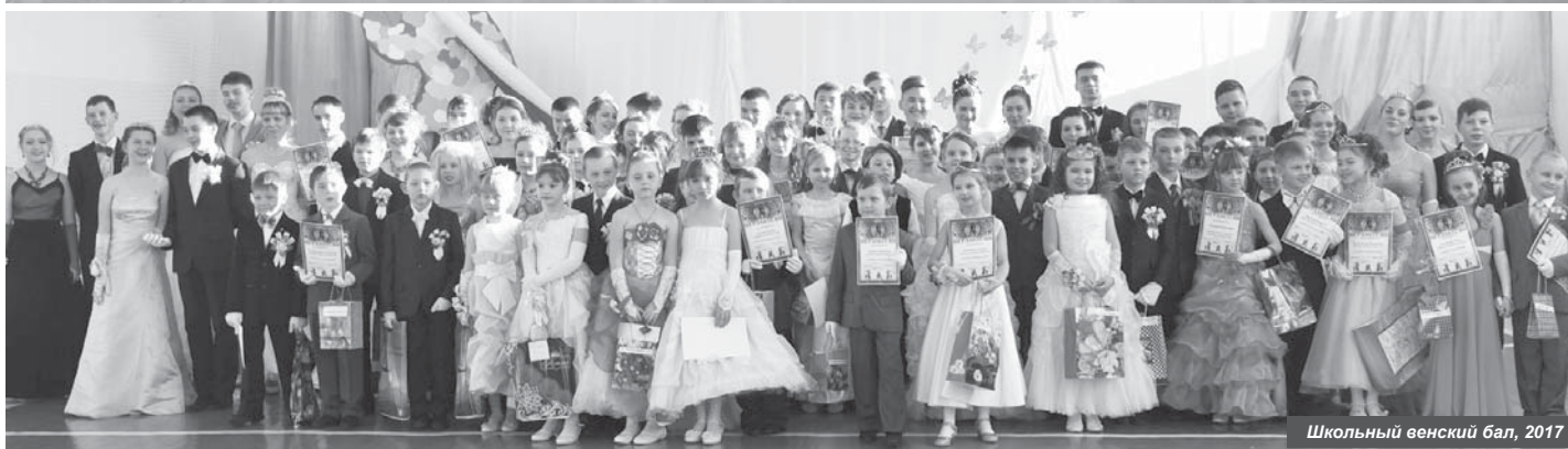
Школьный венский бал, 2017