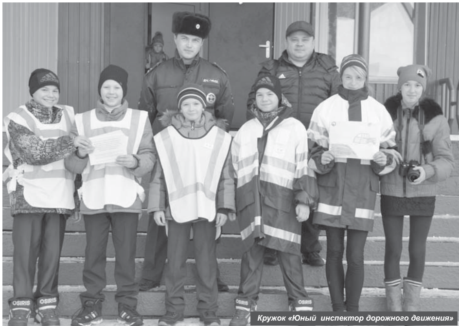
Кружок «Юный инспектор дорожного движения»