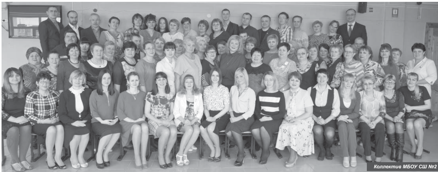
Коллектив МБОУ СШ №2

В этом году средняя школа № 2 п. Усть-Камчатска празднует 35-летие со дня основания учреждения. В связи с этим в нашей газете будут опубликованы материалы, посвящённые круглой дате и касающиеся всех сторон школьной жизни.