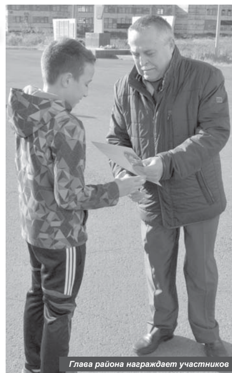
Глава района награждает участников

Мальчики и девочки 5-6 классов (дистанция 700 м):